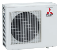
MXZ-3F / MXZ-4F