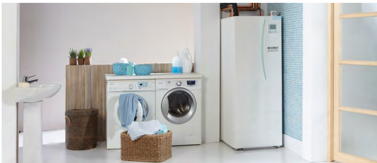
Pavyzdys. Šiuolaikinė katilinė su įdiegta ECODAN talpykla